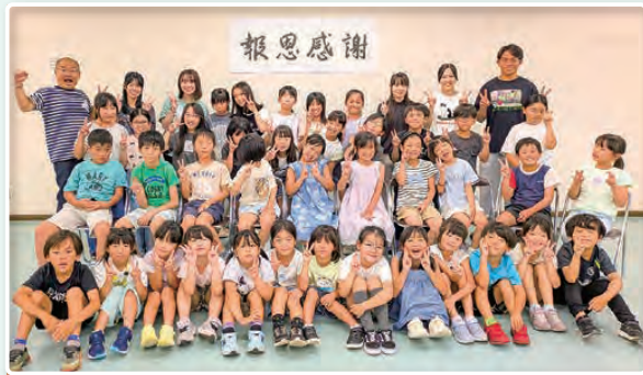
現在は西宮市と協業で西宮市初の民設民営学童保育を自営の当社で運営