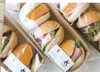
学生と企業が共同開発した商品