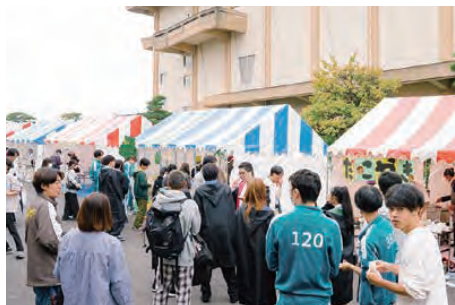
ホームカミングデー当日は『愛学祭』も同時開催!