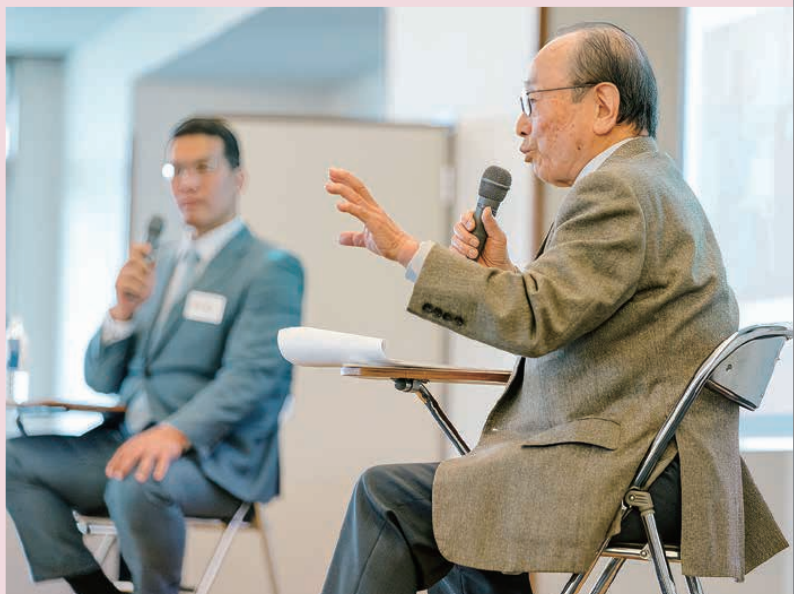
第3回ホームカミングデー