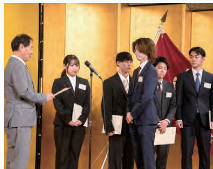
奨学生証書授与式