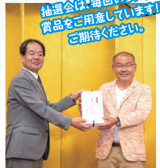
お楽しみ抽選会で1等賞に当選(右)